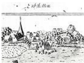
Erbstetten um 1680

Erste urkundliche Erwähnung findet Erbstetten im Jahr 794.