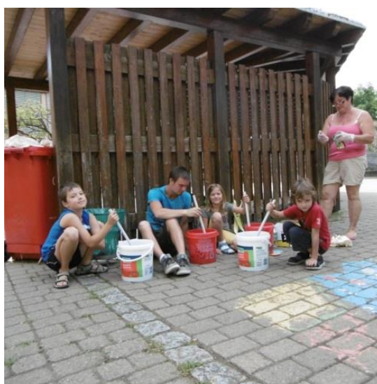
Batiken war einer der Programmpunkte bei der Schulkinder-Ferienbetreuung.

In diesem Jahr bot die Gemeinde erstmals eine gesonderte Ferienbetreuung für Grundschüler an. Seither wurden die Schüler bei Bedarf in den gemeindlichen Kindergärten betreut, nunmehr wird ein altersgerechtes Programm angeboten. In den Sommerferien und übrigen Schulferien konnten die Grundschüler im Rahmen der Vormittagsbetreuung an Ausflügen, Bastelaktionen oder Sporttagen teilnehmen. Die Ferienbetreuung ist eine tolle Möglichkeit für berufstätige Eltern, ihre Kinder in sichere Hände zu geben und ihnen gleichzeitig schöne und erlebnisreiche Ferien zu verschaffen.