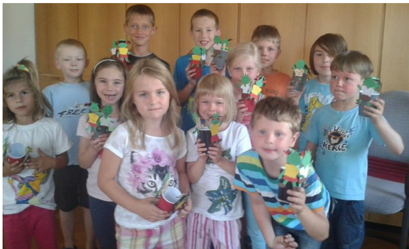
Ortsbücherei „Spaß mit den Olchies“

Dank des vorbildlichen Engagements der örtlichen Vereine, Kirchen sowie der Ortsbücherei und einigen Privatpersonen konnte auch im Sommer 2015 mit 22 Programmpunkten ein abwechslungsreiches Ferienprogramm zusammengestellt werden. Das Angebot reichte vom Aquatollbesuch über eine Nachtwanderung bis hin zu Sport- und Geschicklichkeitsspielen. Insgesamt waren 104 Anmeldungen für die einzelnen Programmpunkte bei der Gemeindeverwaltung eingegangen.