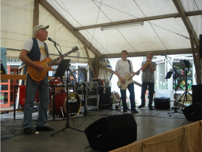
Am Sonntagabend standen „The Rollics“ auf dem Programm.