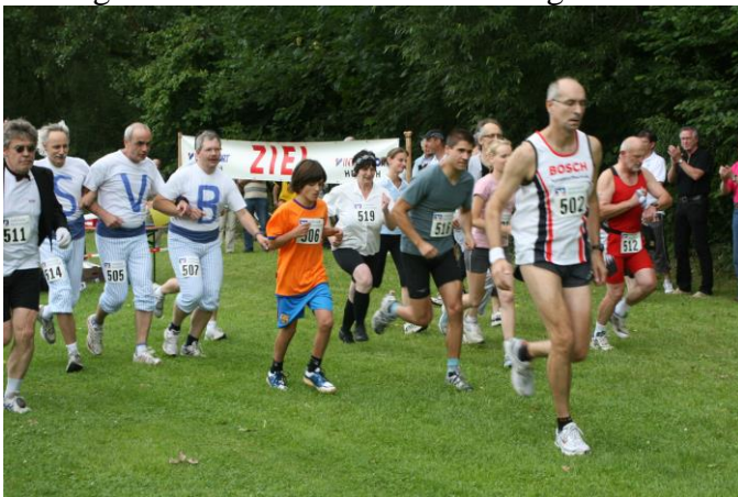
Bild vom Gründungslauf

Mitte Juli fand anlässlich des Jubiläums des SV Burgstall ein Festwochenende am Sportplatz in Burgstall mit einem attraktivem Programm statt.