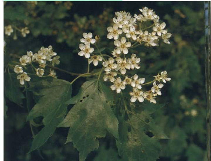
Elsbeere ( Sorbus torminalis )