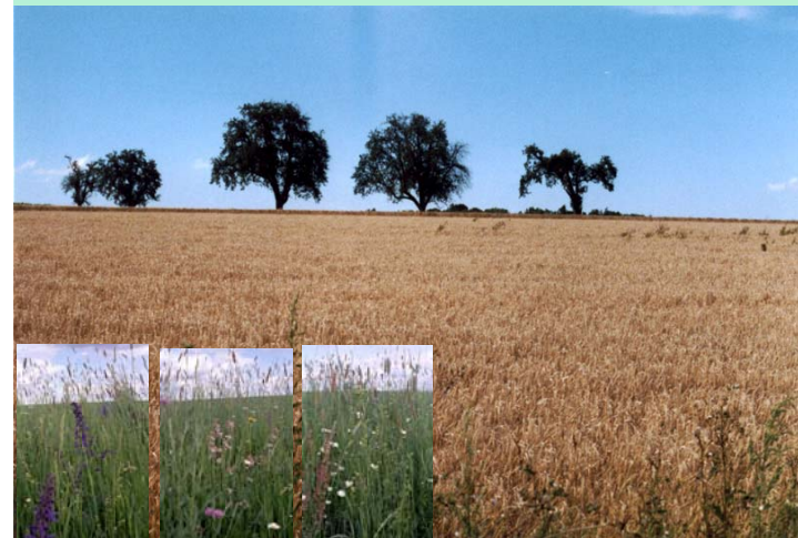
Auf den Rüdern